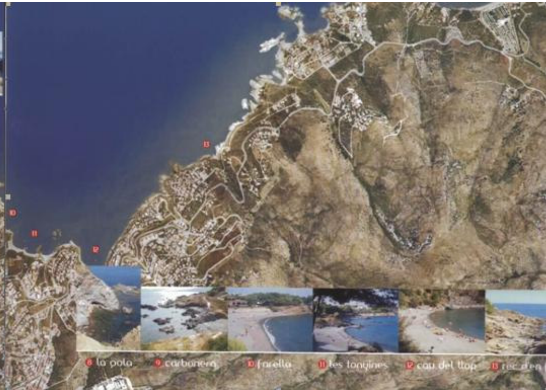
8 la poto 9 carbonera 10 farella 11 les tanques 12 cau del top 13 rec d'en