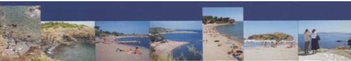
1 el rastell 2 bramant 3 canyelles 4 cros 5 prífeu 6 el port 7 castellar